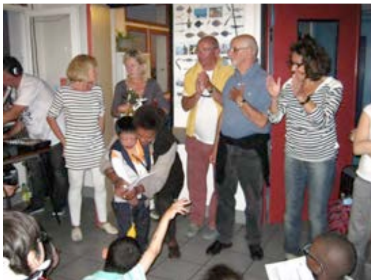
Régate des Oursons 2011 - Remise des prix

Et puis est arrivé ce merveilleux projet de Régate des Oursons qui était porté par l'Association et chacun d'entre nous. Par son ampleur, par le nombre d'enfants et de professionnels engagés, elle aura été la manifestation la plus spectaculaire au service du sourire et du rêve en partie réalisé par des enfants malades.