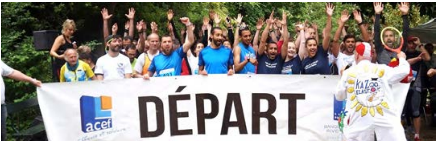
Photo : départ de la course « Courir pour les enfants de Robert-Debré »

* Nos comptes de résultats sont vérifiés par notre Expert comptable et validés par notre Commissaire aux comptes lors du conseil d'administration et de notre assemblée générale annuelle.