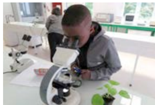
Journée découverte INRA