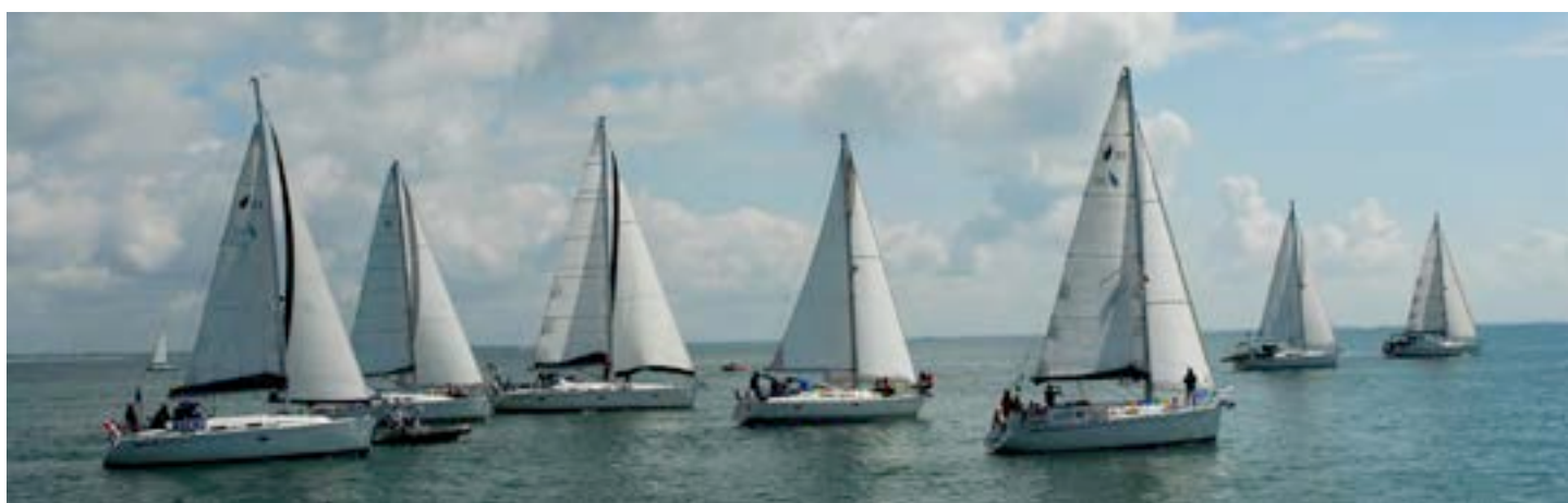
La Régate des Oursons