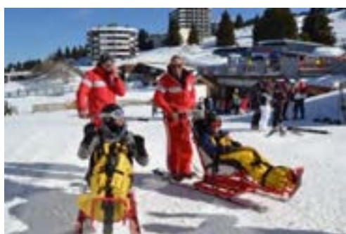
Séjour Handi-ski évasion