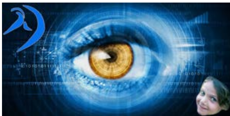
L'œil du futur...

Certains paramètres sont évidents : il y aura toujours des enfants malades (et des femmes enceintes à surveiller et à accoucher) ; Robert-Debré est un grand hôpital très attractif où les enfants et les soignants se sentent plutôt bien ; le problème de financement de l'hôpital public est pérenne. La récente loi santé confirme que l'aide extérieure pour améliorer les structures de soins, les services et les plateaux techniques, est indispensable.